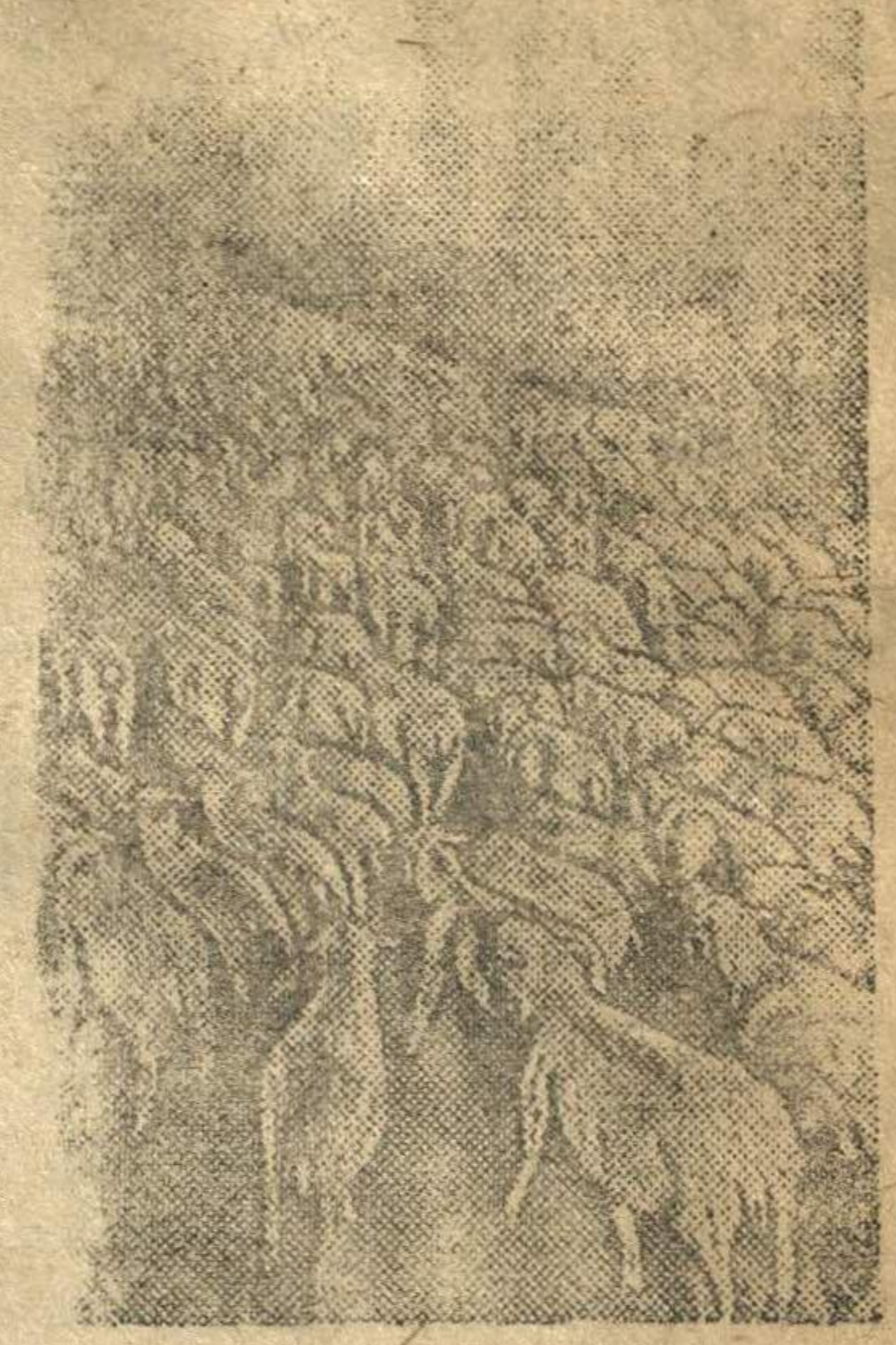
На снимке: Стадо овец возвращается на родные пастбища (Ростовская область).

Восстанавливается животноводство в освобожденных районах страны.