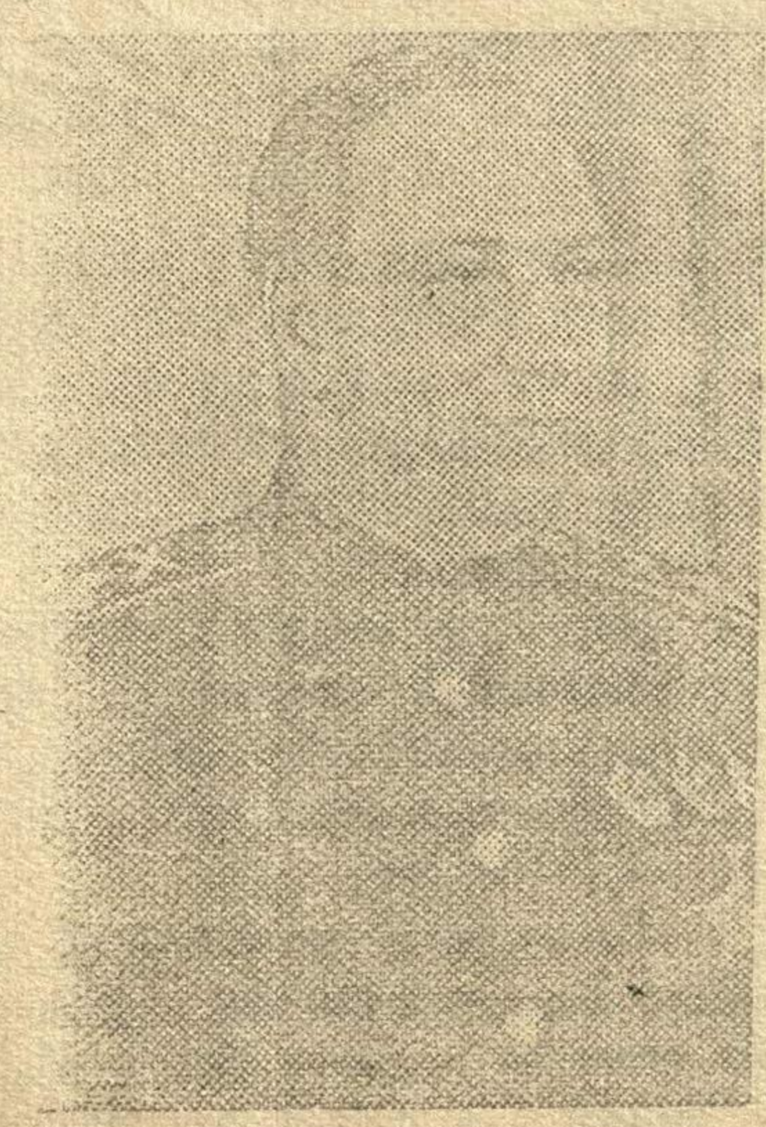
Маршал артиллерии Н. Н. ВОРОНОВ.