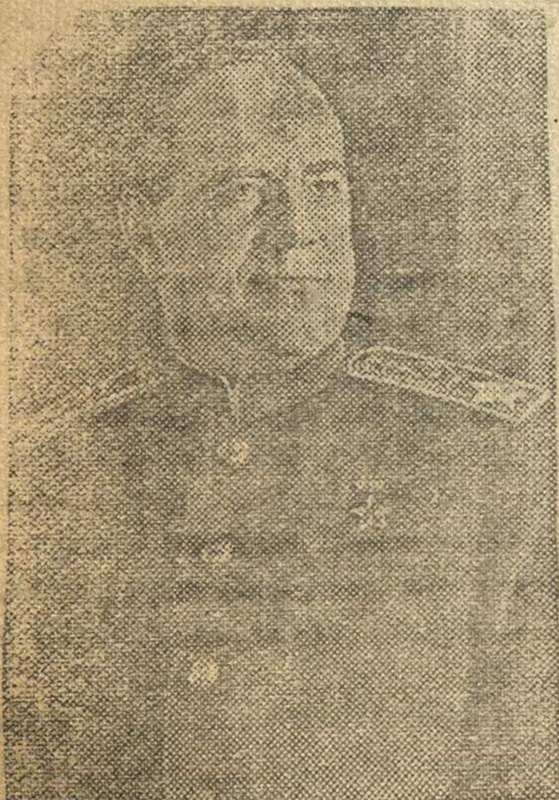
Маршал Советского Союза Г. К. ЖУКОВ.

Секретарь Президиума Верховного Совета СССР А. ГОРНИН Москва, Кремль, 9 мая 1945 года.