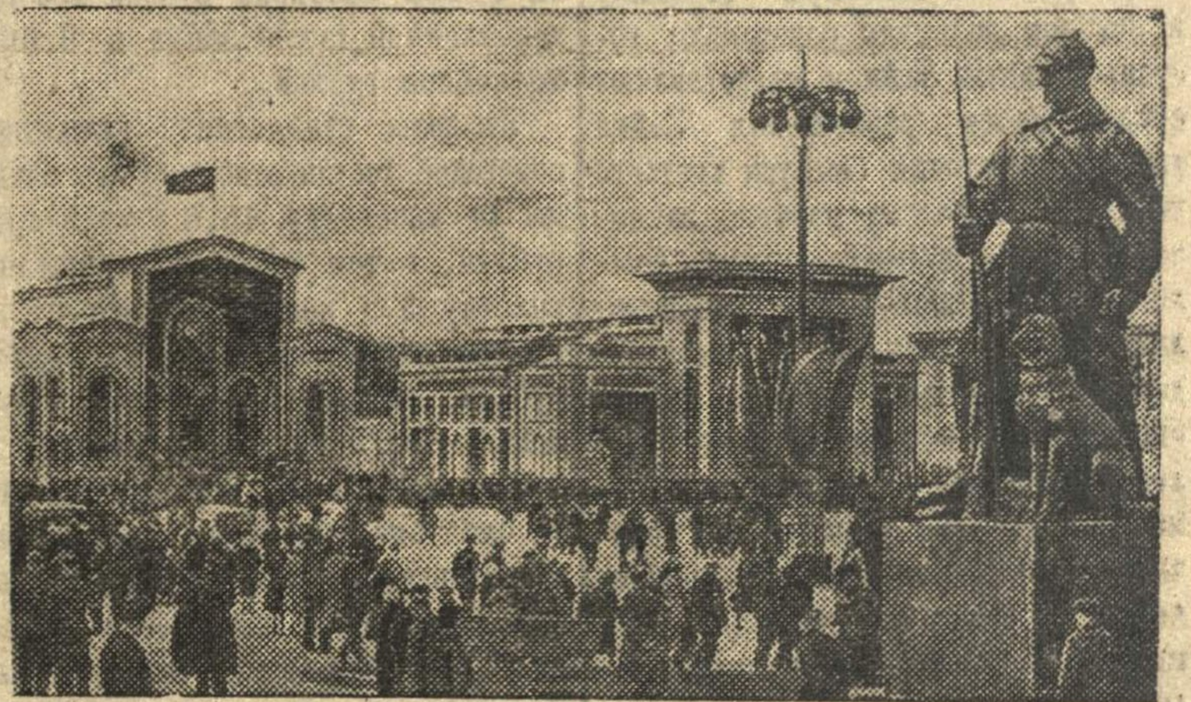
Площадь Колхозов в день открытия выставки.