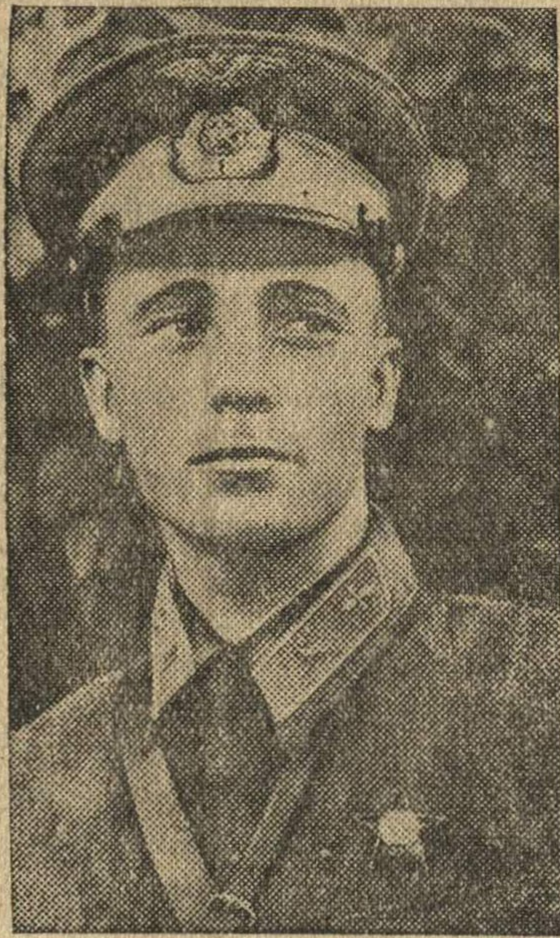
Герой Советского Союза летчик-истребитель младший лейтенант В. В. Талалихин. Он героически атаковал и протаранил фашистский бомбардировщик „Хейнкель-111“, пытаясь прорваться к Москве.

Колхозники и колхозницы нашего района с честью выполняют стоящие перед ними задачи. Необходимые запасы овощей и картофеля для фронта и промышленных центров будут созданы.