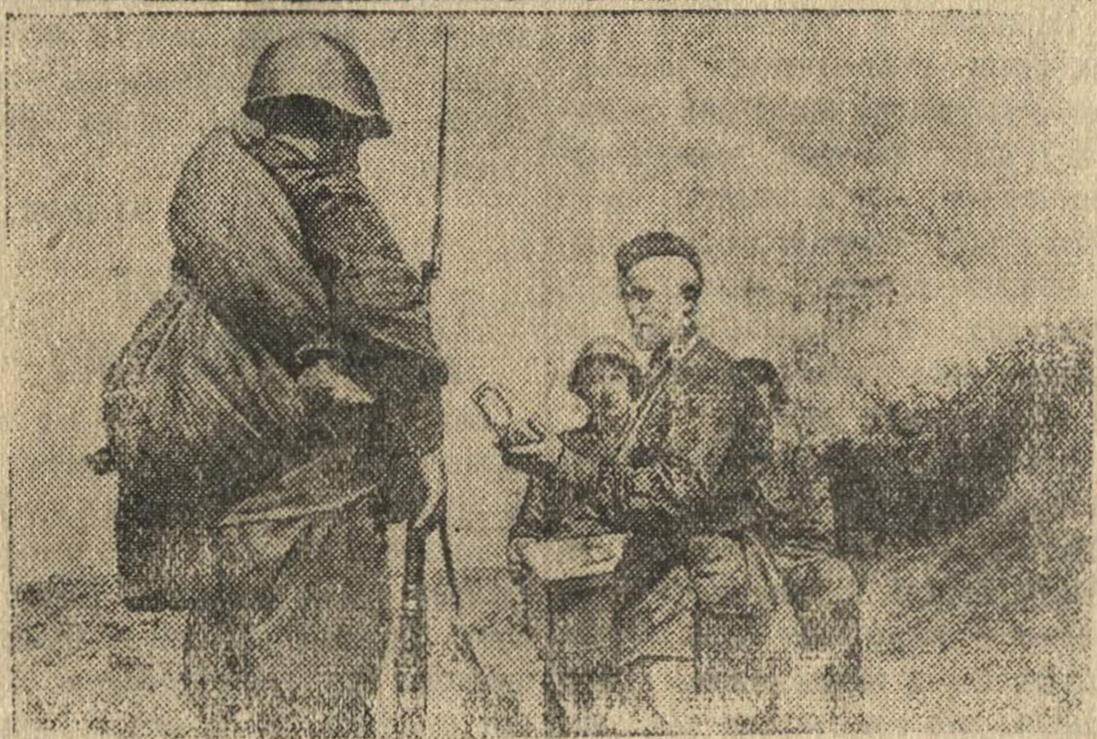
Раздача подарков от трудящихся бойцам на передовых позициях. (Западное направление)