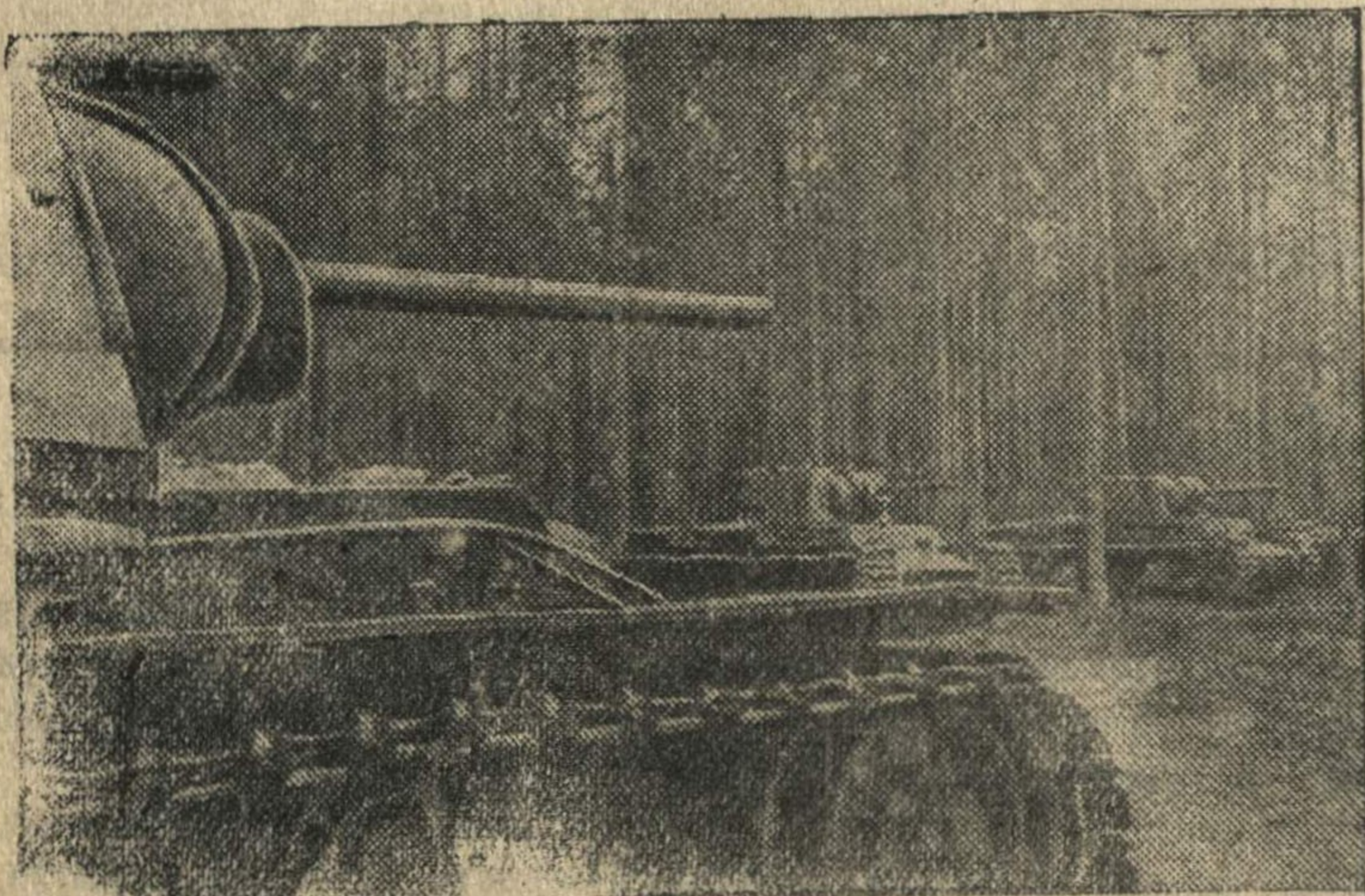
На снимке: Танки на исходной позиции.