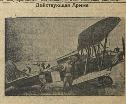
Отправил раненых на санитарном самолете в госпиталь.