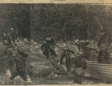
Балтийцы выкашивают десант на вражеский остров.