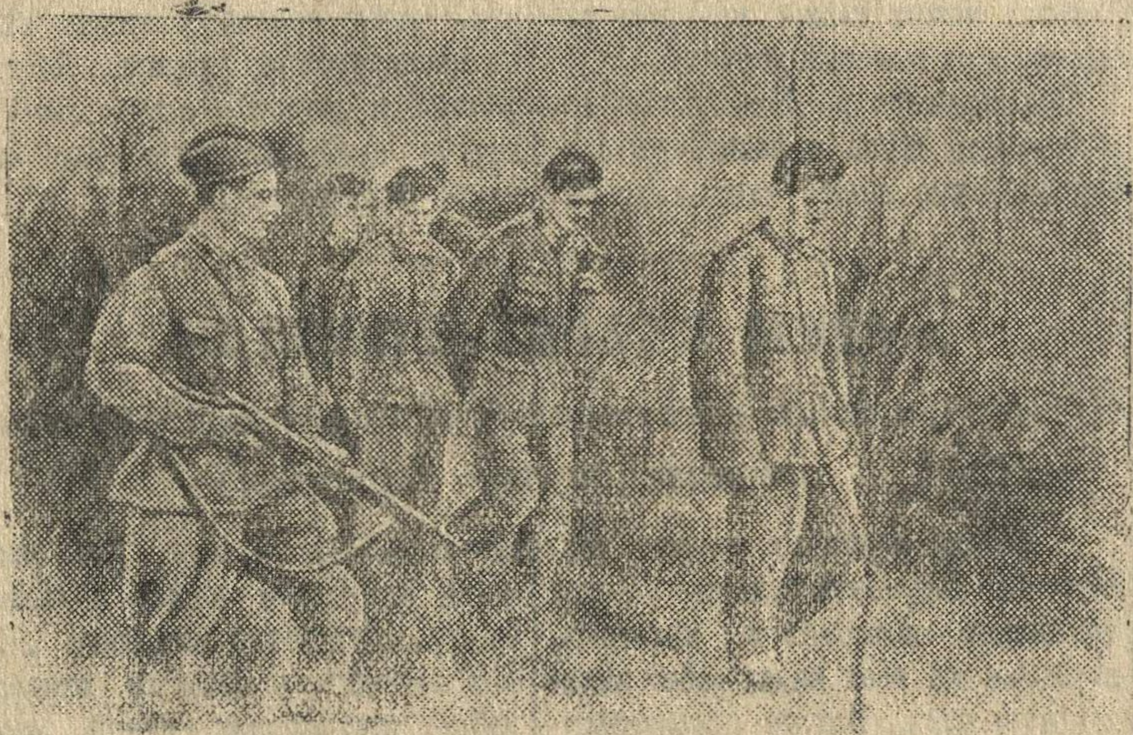
Группа гитлеровцев, захваченных в плен, направляется в тыл.