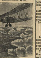
НА СНИМКЕ: Самолет Ил-50 нашей авиации, совершая боевые вылеты на выполнение заданий в тыл врага.

Командир приказал старшине доставить патры от тов. Храменко в военный трибунал. Толстым был вечер в землянках. Вместе с окружения выжила, в атаку ходили, ренных товарищей под огнем спасали, и под выла из землянок.