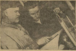
Студенты на практике