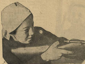
Вместе с овладением знаниями студенты готовятся к обороне страны.