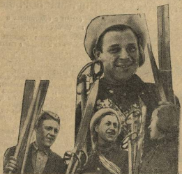
На снимке: Момент коллективной студенческой езды на лыжах, как редко встретишь в институтах и техникумах города.