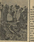
Недалеко от города находится глубокая Петрушиновская балка. Малые реки превратили ее в «лагуна» пруда. Тысячи жителей Тагасиро — мужички, крестьяне, дети — купались в лагунах балки. После освобождения германские трусы жертв гитлеровских палачей были похоронены на Петрушиновской балке и захоронены в братской могиле. На снимке: Работники омыли трусы.

Н. Лежнина, заведующая партийным отделом РК ВКП(б).