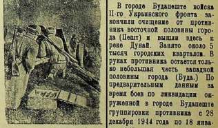
Противотанковая пушка сержанта И. И. Прохорова ведет огонь по фланкам танков врага.

На фронте Будапеште войска 11-го Украинского фронта заключили соглашение с противником восточной половины города (Пешт) и вышли здесь к реке Дунай. Вдоль этого 5 тысяч человек вытеснили. В руках противника остается только небольшая часть западной половины города (Буда). По предварительным данным за время боя по ликвидации окруженной в городе Будапеште группировки противника с 28 декабря 1944 года по 18 января 1945 года войска 11-го Украинского фронта заняли в плен 59390 немецких и венгерских солдат и офицеров.