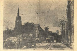
На улицах Берлина, занятых войсками Красной Армии.