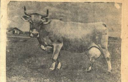
В пленении сельхоз «Кировское» Котельничской области выведены новые породы выведенные крупного рогатого скота, имеют более высокие продуктивные качества.