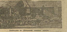
Хлебодария на Шуваловском сыпном пункте.