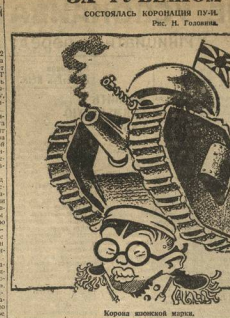
Корона южной марш.

В прошлом году выданные обязательства... (The text reports on unmet obligations.)