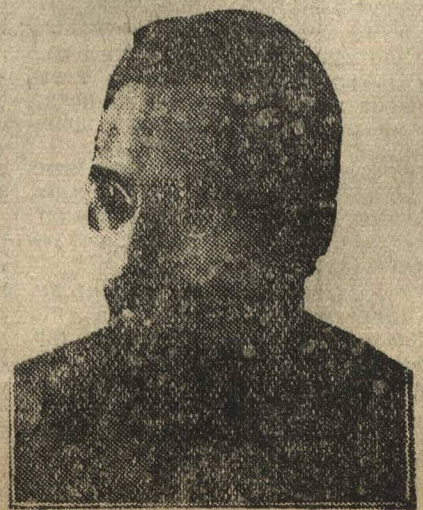
Глава советской делегации тов. КАРАХАН.

С приветствием монгольской армии и представителей монгольского народа выступил т. КАРАХАН, отметивший сплоченность руководства и крепкую революционную связь между правительством и трудовым орденом, огромный рост национального сознания и национально-культурный, рост армии и т. д.