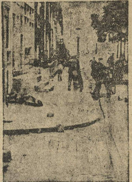
На тротуаре труп рабочего, убитого при столкновении с полицией.