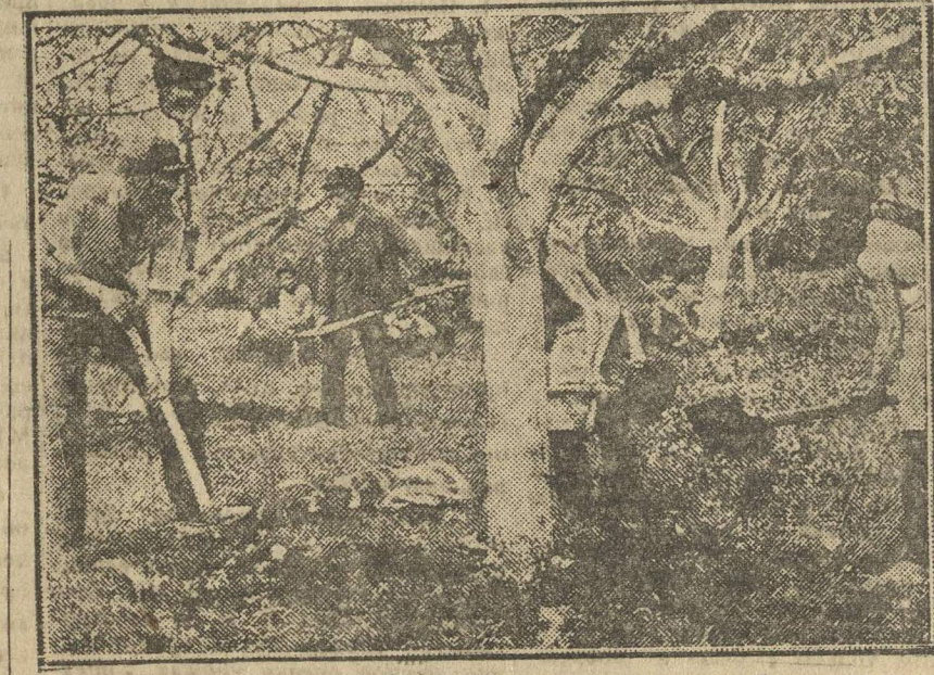
«... Несмотря на знойный жаркий день, садовничья бригада оказалась высокопродуктивной. Есть в бригаде и неподачки, главным образом с нормами выработки. Но, несмотря на это, бригада все же сумела добиться образцового состояния сада.»

обручами восхода солнца, Федька встал, покидая теплую постель и шел в оранжерею помогать садовнику. Круг обязанности молодого помощника был обширен. Его заставляли лезть по крышам теплиц, очищая снег. Он выполнял тысячи мелких работ по поручению садовника и рабочих. С того момента как садовник дал согласие взять его учеником, единственным условием в жизни Федьки было то, что он накапливал опыт в работе по созданию хороших вкусовых яблок для барина и подобных ему. В саду или в оранжерее он прощивал после работ целыми часами и мечтал о чем может мечтать подросток. Алексей Петрович, раскаяжи мне о всех сортах яблок,—спрашивала Федька деда садовника. Сынохотливый старик начинал рассказывать о том, как воспитать