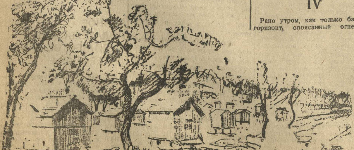
«... 100 ульев стоят на большой лужайке среди большого колхозного сада... От восхода и до захода солнца живет лужайка напряженной жизнью с своим трудолюбивым населением. Эта пасека колхоза «Активист»»

хлеба, который давал ему вечером старый пастух. В усадьбе было празднество. Она выла в кюлье феерверков. Ракетки бороли в облаках огненных борозды. Медью глоток захлебывался оркестр.