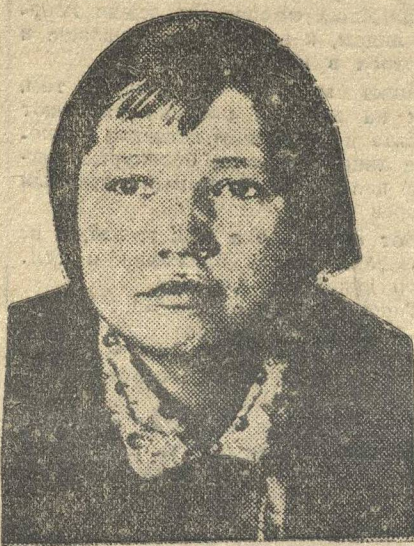
Лучшая ударница. Машстрой-завод.