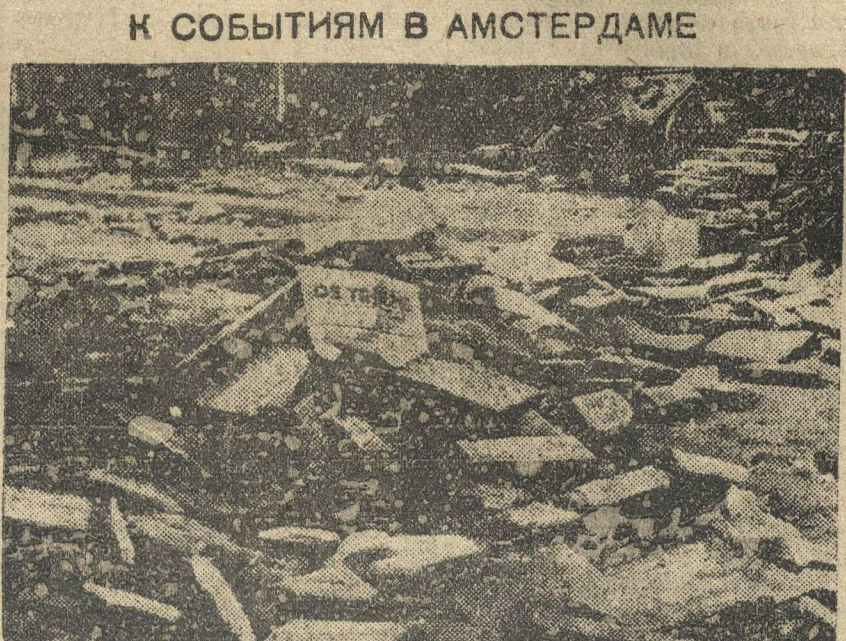
На снимке: на баррикаде в рабочем квартале, взятом штурмом войсками, остался смятый номер голландской коммунистической газеты «Де Трибуне».

В 1933 г. волна стачек охватила все главные отрасли промышленности — стальную, автомобильную, угольную, текстильную, кожевенную и др.