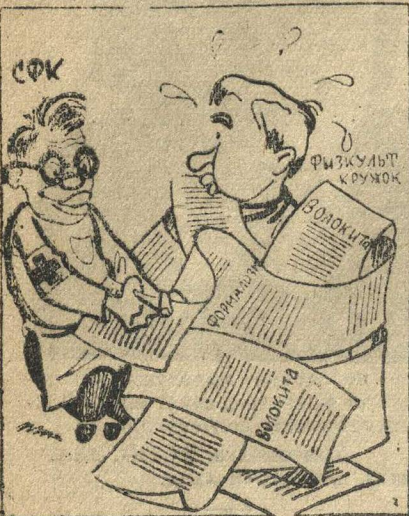
«Поддача» первой помощи.

Огромную работу по подготовке к сдаче военно-технического экзамена бюро физкультуры предоставило самоотечку.