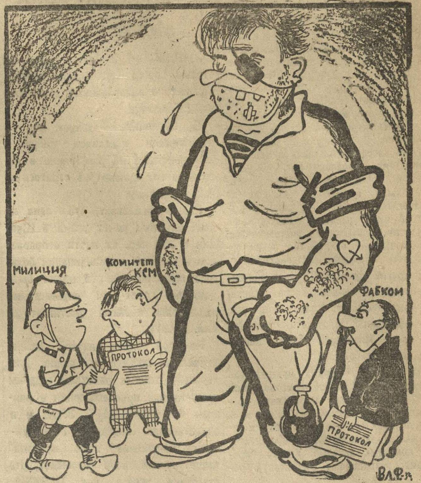
Рис. Вл. Фомина