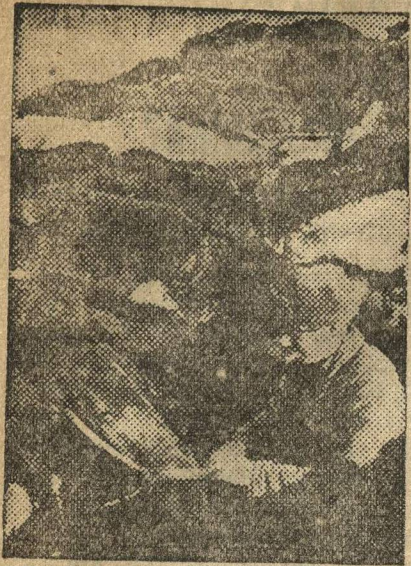
ЗАБОТЛИВО УХАЖИВАТЬ ЗА КОНЕМ НА ПОЛЕВЫХ РАБОТАХ.