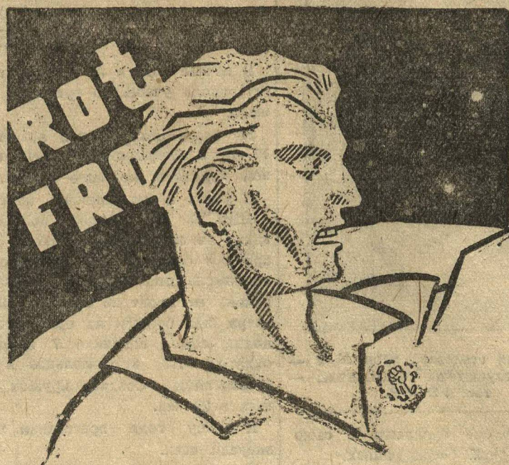
Мы еще вернемся!

На основании положительного опыта Советского Союза, эта молодежь с оружием в руках шла завоевывать советскую власть у себя.