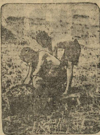
В НОВИНСКИХ ПИОНЕРЛАГЕРЯХ. Пионеры собирают колосья на полях подшефного колхоза.