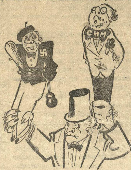
Одна лучше другой

В рабочих лагерях молодежь начинает бунтовать. Многие лагеря были распушены, в других добились частичного удовлетворения требований рабочих. Большинство австрийской