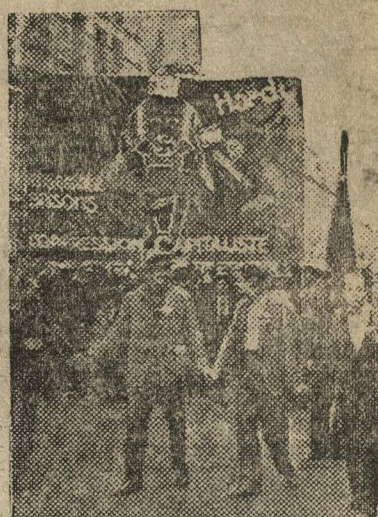
НА СНИМКЕ: демонстрация единого фронта в Париже в день двадцатилетия убийства Жореса.