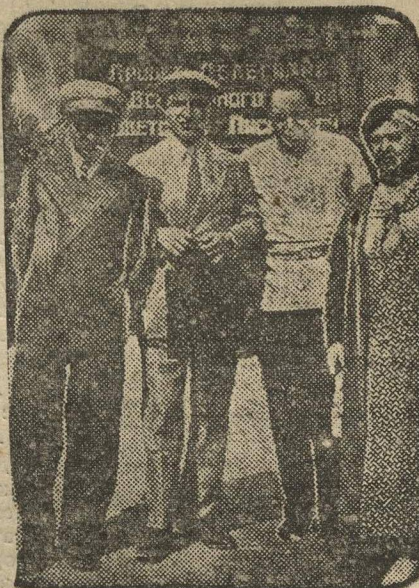
НА СНИМКЕ: делегаты съезда — писатели Армении у входа в оргкомитет союза советских писателей.

Этот эпизод нам вспомнился сегодня снова при виде огромной очереди за гостевыми билетами.