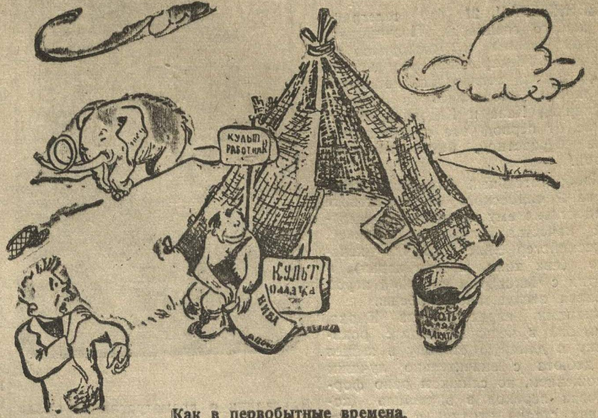
Как в первобытные времена.

БУТУРЛИНО (от нашего специального корреспондента). Заготпункт при станции Смагино — межрайонного значения. Ежедневно сюда стекаются хлебосдатчики Бутурлинского, Б.-Мурашинского и др. районов. Они выполняют свой первоочередной долг перед государством.