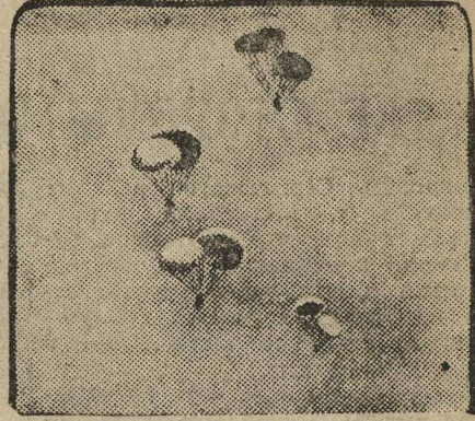
Групповой прыжок на парашютах.

— «Господа, надо как можно скорее помочь этому ребенку... Когда соберемся в следующий раз».