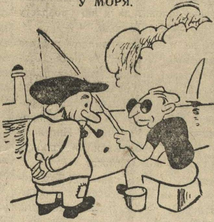
— «Ну, что выудил? Да, должно клонуть. Вчера тут 200.000 коробок консервов сбросили.» («Муха», Варшава).