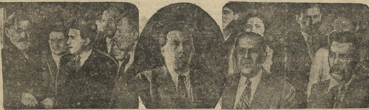
НА СНИМКАХ (слева направо): Феликс Кон среди делегатов Белоруссии, Илья Эренбург выступает в прениях, Горький и Толстой среди делегатов съезда.