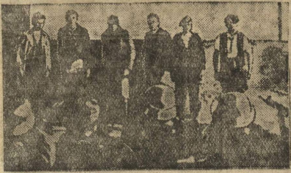
ле баррикадных боев в Вене. Ивские капиталисты расстреливали шуббундовцев.