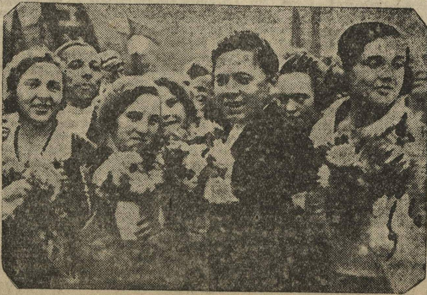
Участники молодежной демонстрации в гор. Горьком. (Свердловский р-н)

♦ ГОРЬКИЙ. Многолюдные демонстрации и митинги состоялись во всех районах Горького.