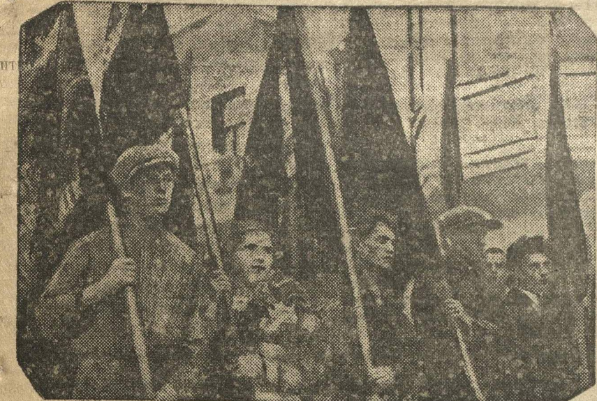
Рабочая молодежь на демонстрации XX Международного Юношеского дня в городе Горьком.