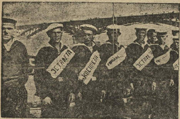
...Участники эстафеты — физкультурники города ГОРЬКОГО слушают последнее напутственное слово.