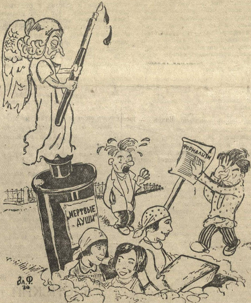
ЧИНУШИ И ДЕВУШКИ.