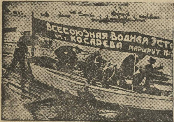
После команды физкультурники быстро занимают свои места. Организованность и дисциплина должны быть верными спутниками эстафеты с первого шага...