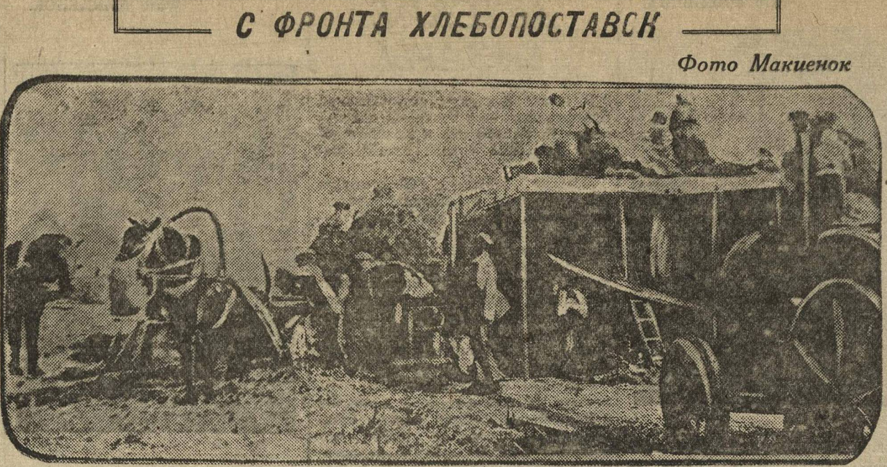
Молотьба яровых на сложной молотилке в колхозе «КРАСНЫЙ МАЯК» (Городецкий район).