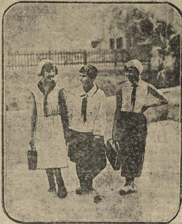
ИДУТ НА УЧЕБУ.