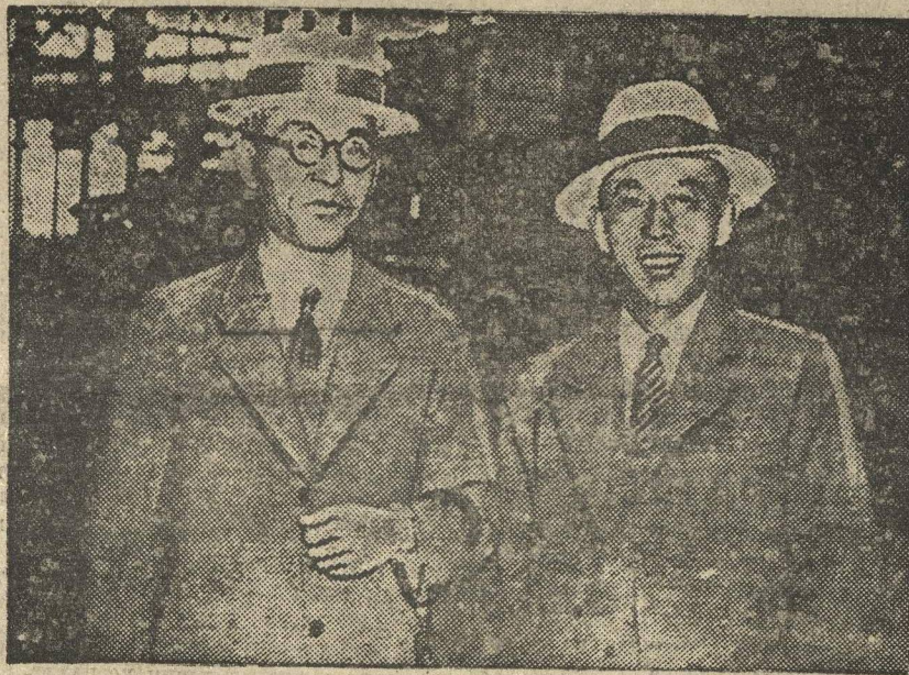
НА СНИМКЕ: японский капитан Ивашита (слева), прибывший в Лондон для предварительных переговоров, в связи с предстоящим в будущем году созывом морской конференции по вооружениям. Рядом с ним японский морской атташе в Лондоне капитан Арата-Ока.