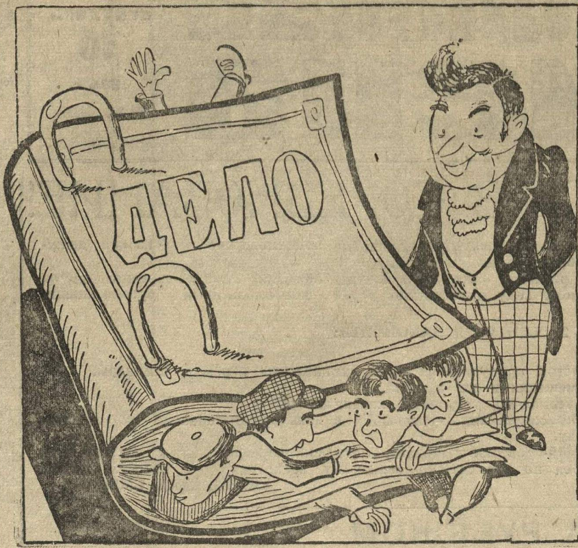
ПОДШИТЫЕ К ДЕЛУ...