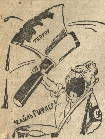
«ПОЭМА О ТОПОРЕ».