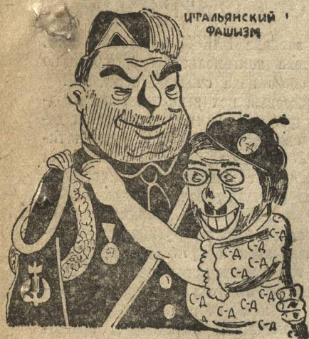
«РОМЕО И ДЖУЛЬЕТТА».