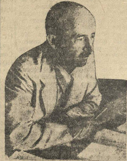
Министр иностранных дел Чехословакии ЭДУАРД БЕНЕШ, председательствовавший на последней ассамблее (заседании) Лиги наций.