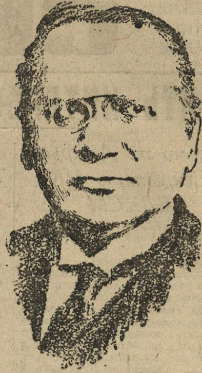
Тов. М. М. ЛИТВИНОВ.

жать возникновение военных действий или помешать им», «оказать неким бугорком на пути к тому, чтобы хотя бы несколько затруднить дело войны и облегчить в некоторой степени дело мира». Уже в беседе своей с американским корреспондентом Дюранти, из которой взяты вышеприведенные слова, тов. Сталин сказал: «Если таков будет ход исторических событий, то не исключено, что мы поддержим Лигу наций, несмотря на ее колоссальные недостатки». Исторический ход событий оказался именно таким, как указал товарищ Сталин, и СССР ответил согласием на приглашение Лиги наций.