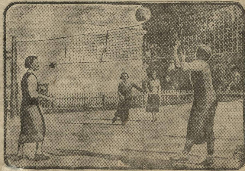
в большой площадке в перемену.