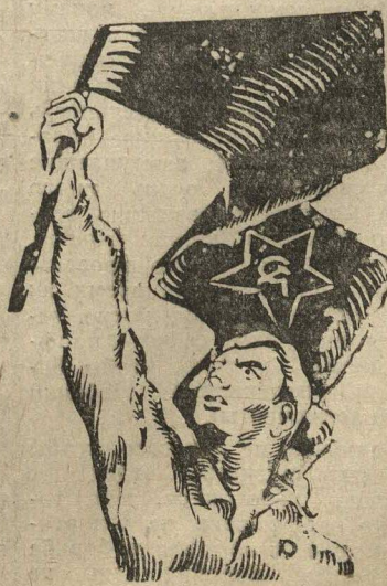
Выход будет найден.

Насколько полно удастся фашистам провести этот закон, покажет ближайшее будущее. Несомненно одно, что проведение его встретится с огромными трудностями, которые еще более расшатывают основы германского фашизма.