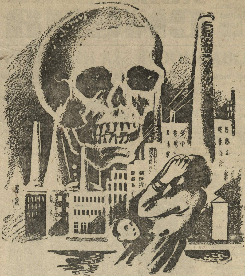
Мираж фашистского благополучия

«Ликвидировав» таким путем безработицу среди молодежи, фашисты приступили к осуществлению плана