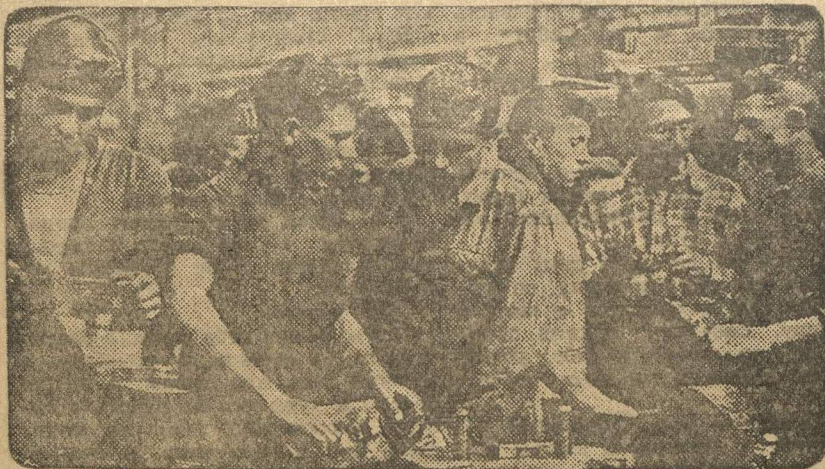
Комсомольская ударная хозрасчетная бригада, организованная в ХХ МЮД'у. (Фото Сосновского).