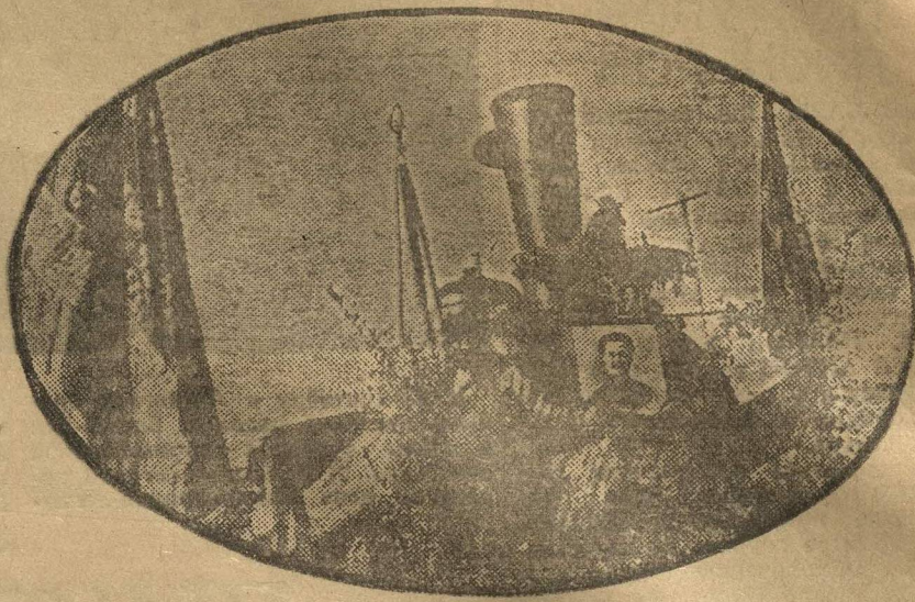
15 сентября открылось регулярное пассажирское сообщение через сонгород Чиркинской. Пуск и эксплуатация этой ветки — новая победа большевиков Средней Азии.

НА СНИМКЕ: первый поезд отправляется в первый рейс.