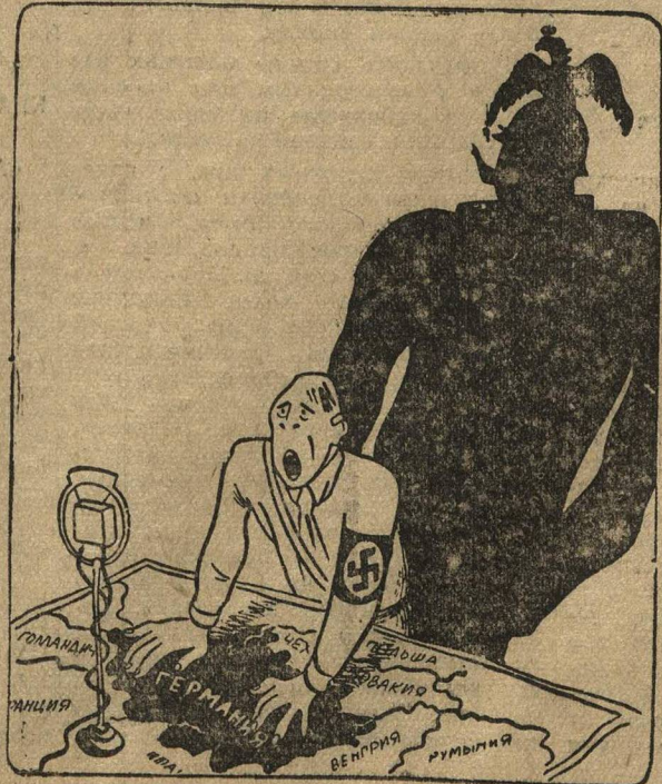
—«Не понимаю, почему мои мирные намерения не могут распространиться на всю Европу».