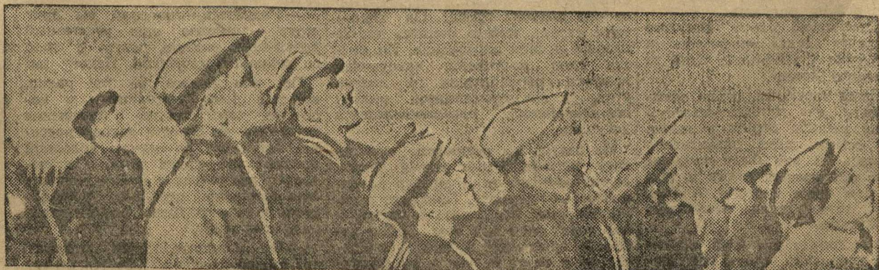
В день парашютизма на Ммзиском аэродроме следят за полетом самолетов.