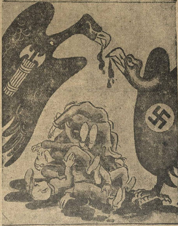
В МИРЕ ХИЩНИКОВ. Делят добычу.