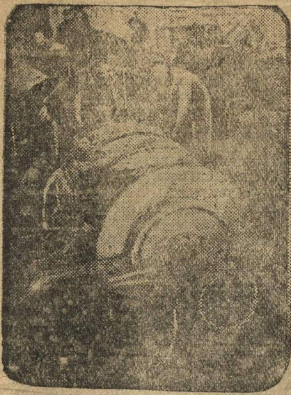
Монтаж первой воздушной машины, изготовленной ленинградским заводом «Красный Путиловец».