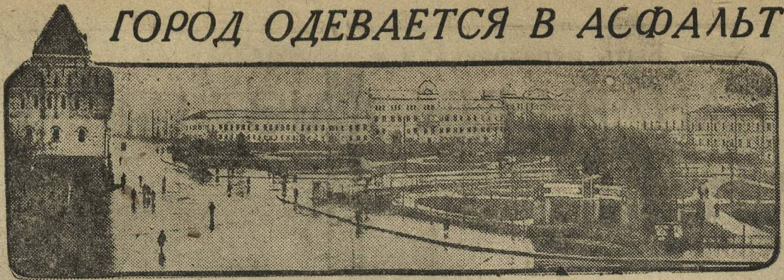
Горсовет и райсовет Горького проделали огромную работу по благоустройству города. В одном Канавинском районе асфальтировано 43 тыс. кв. метров мостовых, 11.900 кв. метров тротуаров, разбито 1406 кв. метров газонов. НА СНИМКЕ: асфальтированная и озелененная Советская площадь города ГОРЬКОГО.

На октябрьский митинг в городе собралось 7 тысяч рабочих-кожевенников. В первой колонне — завод им. Рыкова, первым закончивший годовую программу. Среди других выделяется колонна завода им. Юргенса, показавшая образцы своих достижений — новые виды кожтоваров.