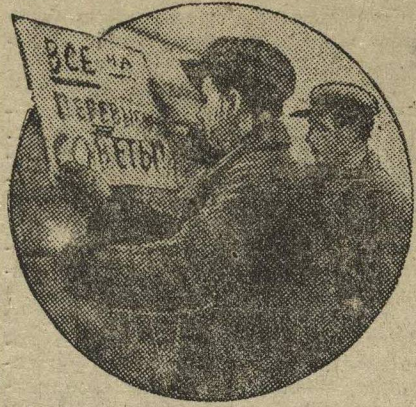
Комсомольцы-активисты развешивают предвыборные плакаты. Колхоз «Красный Словинец», Работкинский район.