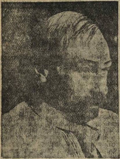
Посторонний гражданин. — А. Д. Александров.