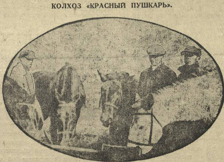
Перед работой поят лошадей. (Фото Макенко).