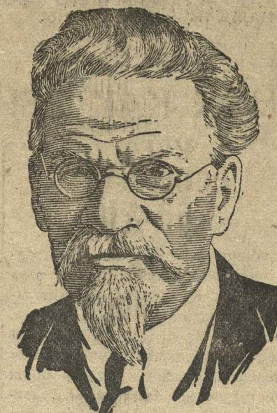
М. И. КАЛИНИН

Но было бы несправедливо не указать и положительные факторы в области цветной металлургии. Алюминиевая промышленность работает хорошо, никелевая растет. Поблизведены значительные разведки и таких дефицитных металлов, как олово. Я, разумеется, привожу только один-два