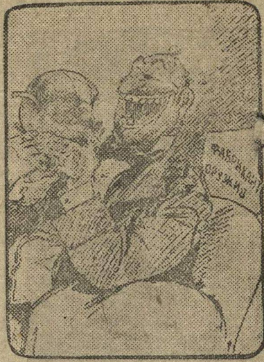
Фабрикант оружия: «Мир — это мое яблоко». (Из газеты «Кливленд Плейн Дилер», США).