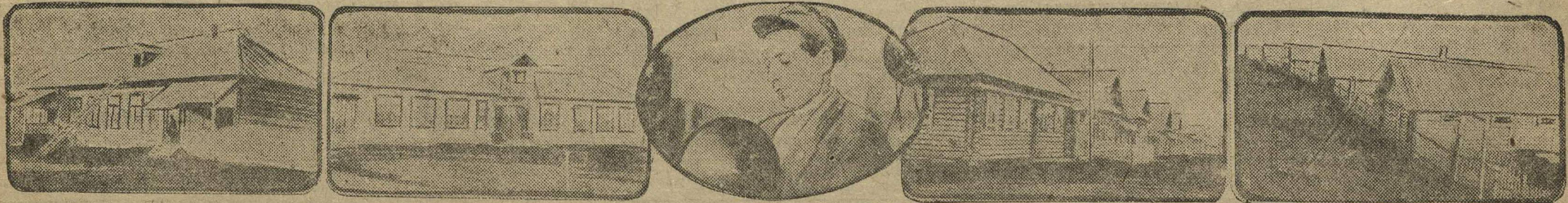
1. Столовая колхоза. 2. Клуб. 3. Радиотехник в собственном колхозном радиоузле. 4. Животноводческий городок. 5. Улица в деревне Кольцовка.