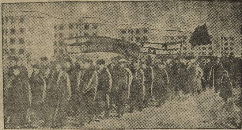
Демонстрация молодых избирателей на автозаводе им. Молотова, состоявшаяся 18 ноября.