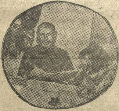
За читкой газеты