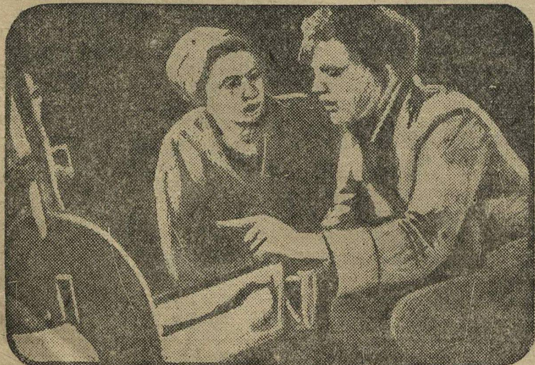
Кадр из фильма «Чапаев». Анна обучается стрельбе из пулемета.