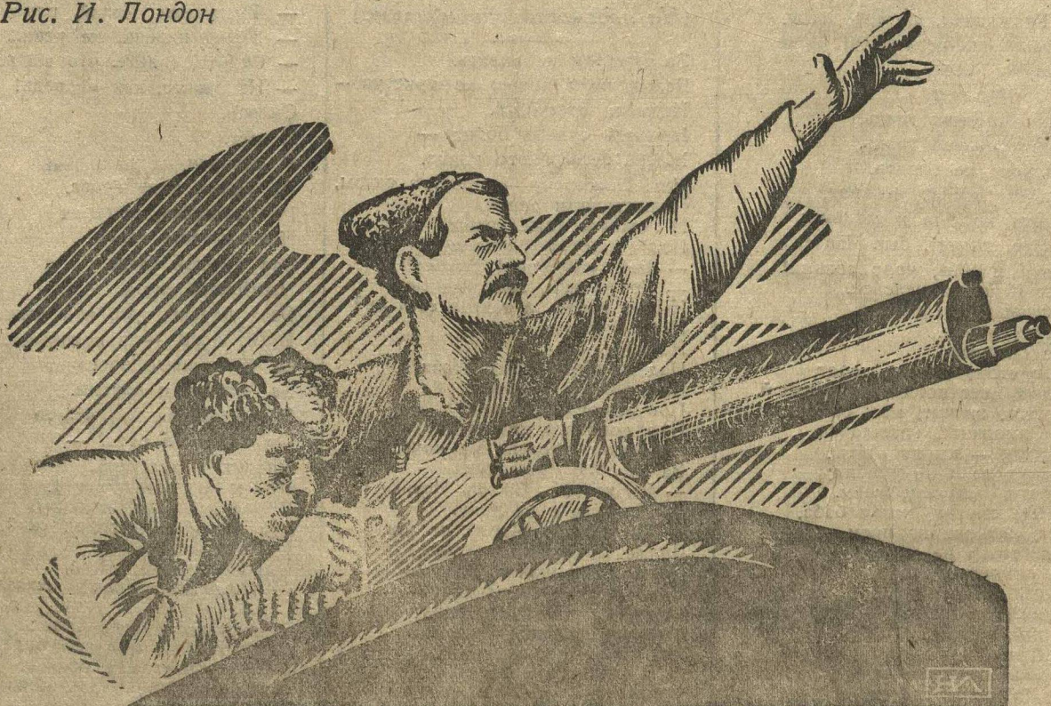
КАДР ИЗ ФИЛЬМА «ЧАПАЕВ».

8. Приступить немедленно к расширению государственной и кооперативной сети лавок для торговли хлебом, увеличив эту сеть до 1 апреля 1935 года не менее, чем на 10 тысяч лавок как за счет дооборудования и приспособления существующей лавочной сети, так и за счет постройки новых магазинов и палаток в соответствии с планом, устанавливаемым Совнаркомом СССР.