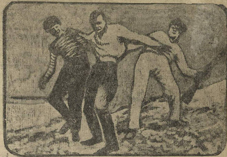
Кадр из фильма «Чапаев. Раненый Чапаев отказывается от помощи, он поплывет через реку Белую сам.

...Всем, всем, всем нужно увидеть эту постановку и испытать то чувство гордости, которое появляется при просмотре этого замечательного достижения искусства.