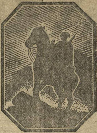
Рис. И. Лондон.