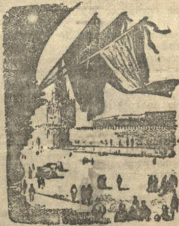
Москва в трауре

сам: как продолжить образование, где и какую найти работу.