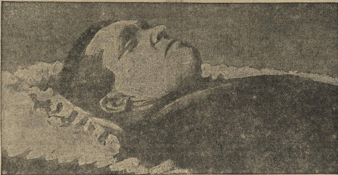
ТОВ. КИРОВ В ГРОБУ.