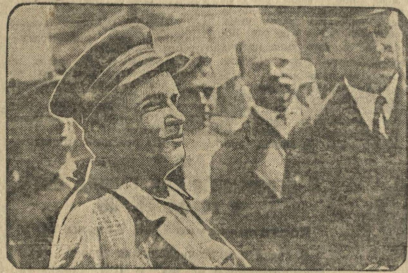
Тов. Киров в Центральном Ленинградском парке культуры и отдыха на школьном празднике завершения учебного года. (Снято в июле 1934 года)

Тов. Сталин и другие члены Политбюро и правительства несут гроб тов. Кирова, устанавливая его на постаменте в колонном зале.