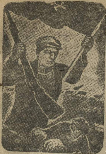
В государственном музее (Москва) открылась выставка графических работ латвийского революционного художника Макса Гинсубрса. НА СНИМКЕ, его плакат: «Война войны».