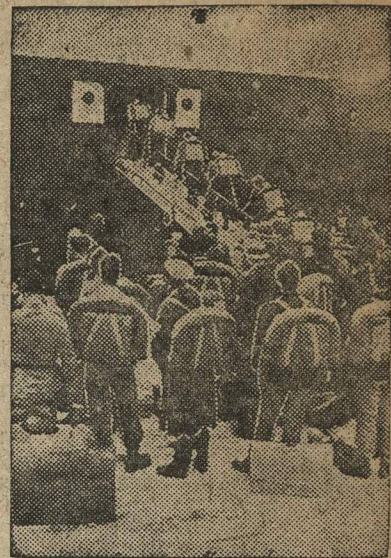
После неудачной попытки восстания в июле 1934 года около 2.000 австрийских фашистов, руководимых гитлеровскими агентами, бежали в Югославию, где были интернированы. Теперь им разрешено покинуть Югославию и они отправляются в фашистскую Германию. НА СНИМКЕ: посадка освобожденных фашистов в порту Фиуме на немецкий пароход.

Отмечая лучших участников второго всесоюзного соревнования по Горьковскому краю, Краевой комитет ВЛКСМ призывает все вузы, вузы и техникумы края на основе развертывания внутривузовского соревнования и подготовки к третьему всесоюзному соревнованию добиваться еще больших успехов в реализации решения правительства от 19 сентября 1932 года и решения ЦК ВКП(б) о Новочеркасском институте.