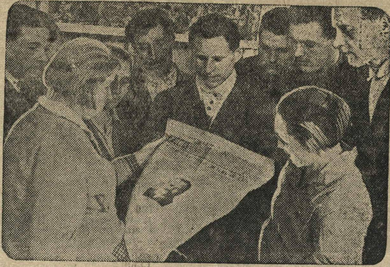
Делегаты Должанского районного съезда советов (Курская область) прорабатывают решения ноябрьского пленума ЦК ВКП(б) об отмене карточной системы.

Рабочие Алатырского краснознаменного лесозавода № 8 обязались дать сверх годовой программы 3000 кубометров пиломатериалов. Рабочие Алатырского завода им. Рудзика сверх январской программы дадут один провоз.