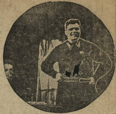
Герой Советского Союза тов. Водопьянов присутствовал на днях в качестве гостя на отчетно-перевыборном собрании в клубе женского вечернего трудового профилектора. НА СНИМКЕ: выступление тов. ВОДОПЬЯНОВА