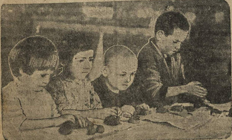
Час лепки на площадке Кочко-Пожарского колхоза Кзыл-Октябрьского района.