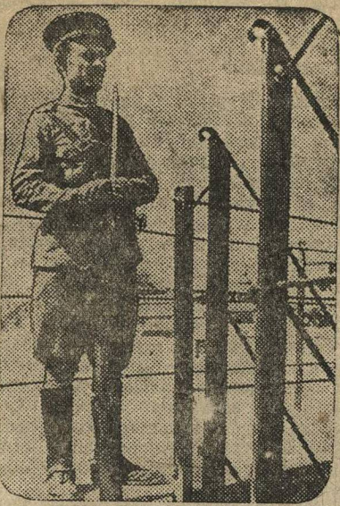
Под Мадридом открыт первый концентрационный лагерь, в котором томятся сотни участников революционного движения испанских рабочих и крестьян. НА СНИМКЕ: часовая у ограды лагеря.