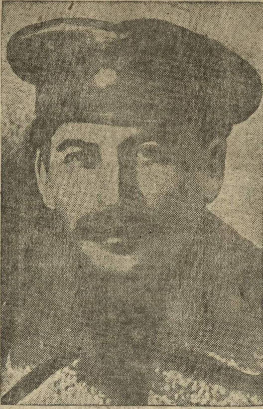
Тов. И. В. СТАЛИН. (снимок сделан в 1919 г.)

По примеру центра, такие же органы должны быть созданы в уездах.