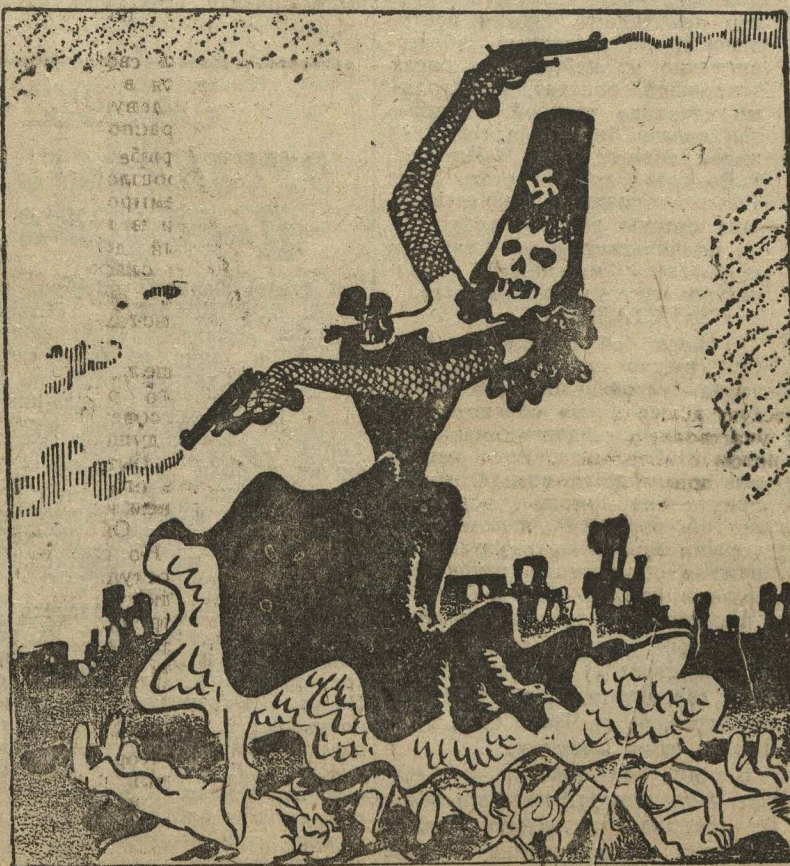
Кармен 1934 года. («Симпликус», Прага).