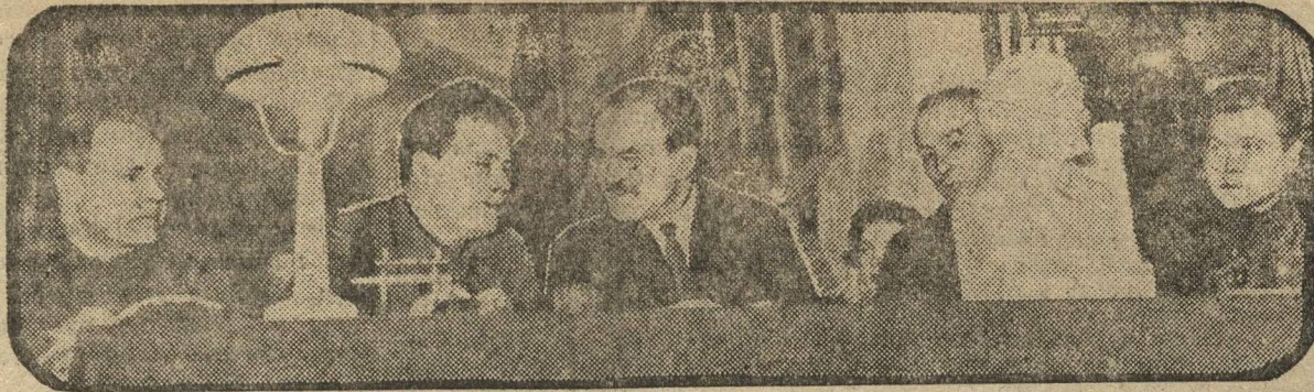
НА СНИМКЕ: тов. Молотов в президиуме выборного собрания завода «Красный пролетарий».

ЧЛЕНЫ ПРАВИТЕЛЬСТВА НА ВЫБОРАХ В МОСКОВСКИЙ СОВЕТ